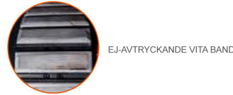
EJ-AVTRYCKANDE VITA BAND